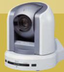
BRC-300P 3-CCD 16:9 Farbvideokamera