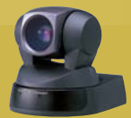
EVI-D100P Farbvideokamera mit Schwenk-/Neige- /Zoomfunktion