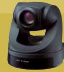
EVI-D70P Farbvideokamera mit Schwenk-/Neige- /Zoomfunktion