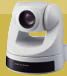
EVI-D70PW Farbvideokamera mit Schwenk-/Neige- /Zoomfunktion