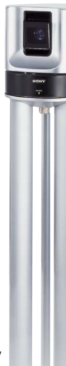
Kameraeinheit und Stativ