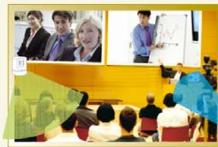
Hauptstelle: Redner und Zuhörer in großem Veranstaltungsraum