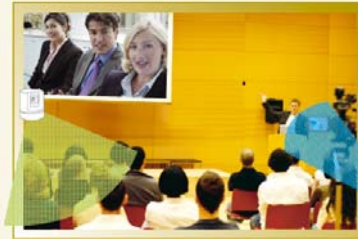
Hauptstelle: Redner und Zuhörer im großen Veranstaltungsraum